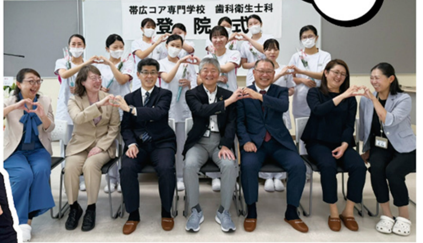
新入生歓迎会 宿泊研修