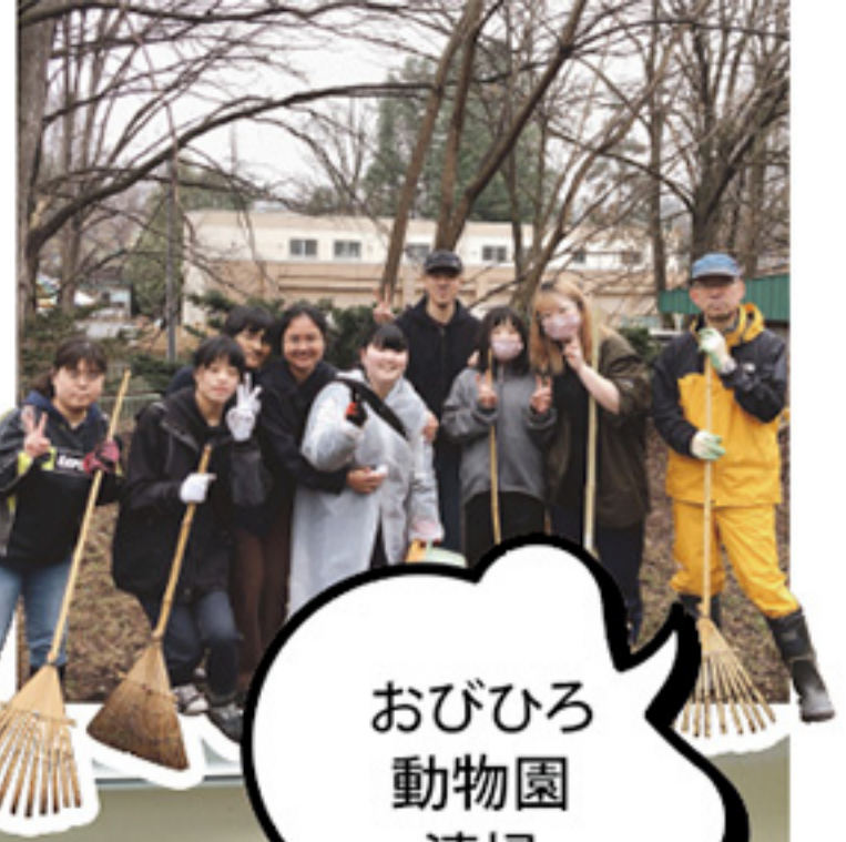
おびひろ 動物園 清掃