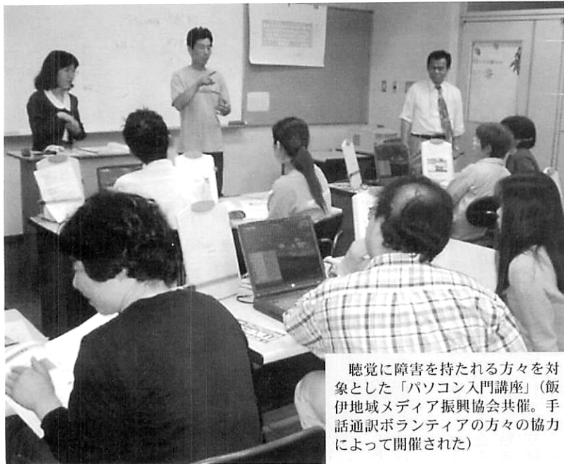
聴覚に障害を持たれる方々を対象とした「パソコン入門講座」(飯伊地域メデア振興協会共催。手話通訳ボランティアの方々の協力によって開催された)

「一人一台の実習用コンピュータによる」飯田コンピュータ専門学校…。当校が開校した昭和六十二年の、学生募集用学校案内のトップコピーである。