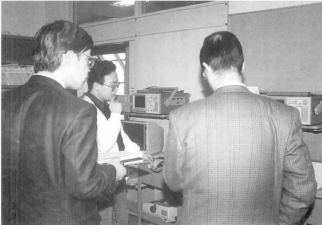
卒業特集は2ページより

去る二月十三日飯田コンピュータ専門学校第五期生の卒業発表会が本校にて行われました。