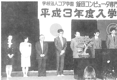
学校法人コア学園 館田コンピュータ専門学校 平成3年度入学

成績優秀者になろうと思いい入学してから三月月たった。今現在は遠い願いだが、最初はわけわからん事も慣れてきた。九時に始まり今は二時半に終わる。時間がある為友達ができる。良いことだ。友達と遊ぶ。楽しい。だが少しのんびり過ぎたと思わないことも